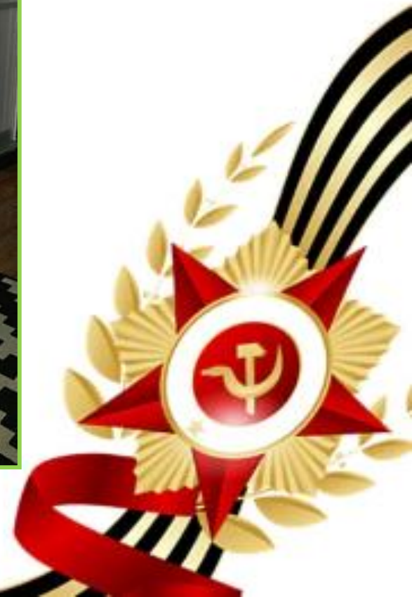
ГБДОУ детский сад № 35 Невского района Санкт-Петербурга