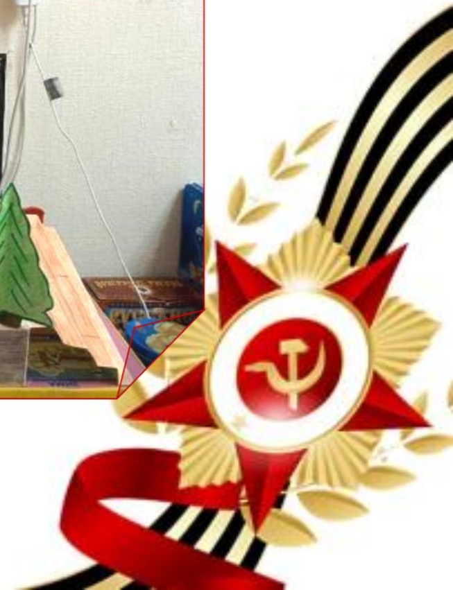
ГБДОУ детский сад № 35 Невского района Санкт-Петербурга