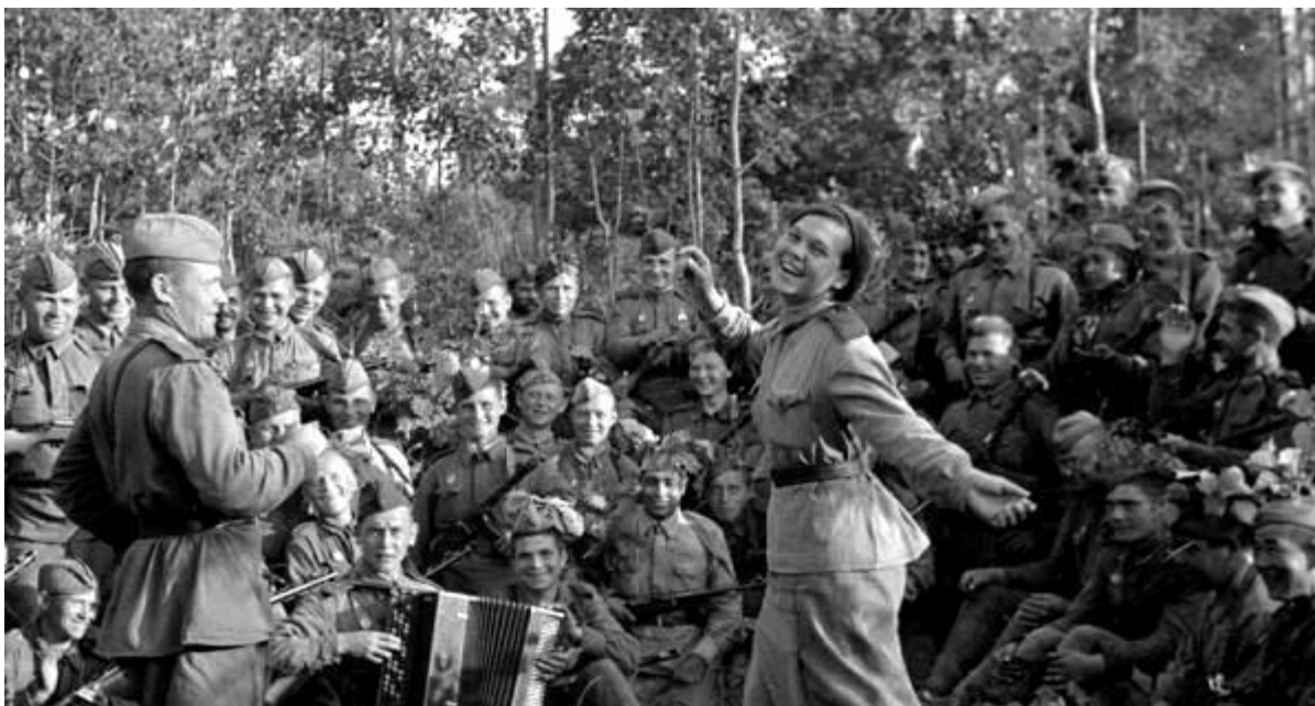
ГБДОУ детский сад № 35 Невского района Санкт-Петербурга